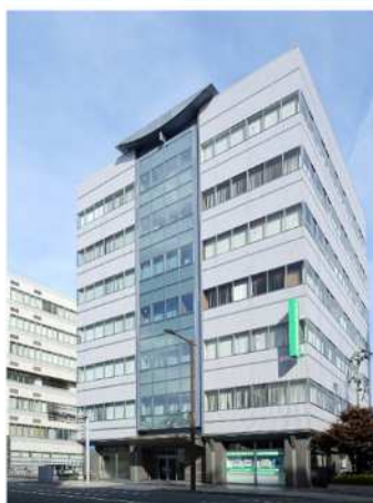
本所ビル（JR盛岡駅から徒歩7分）